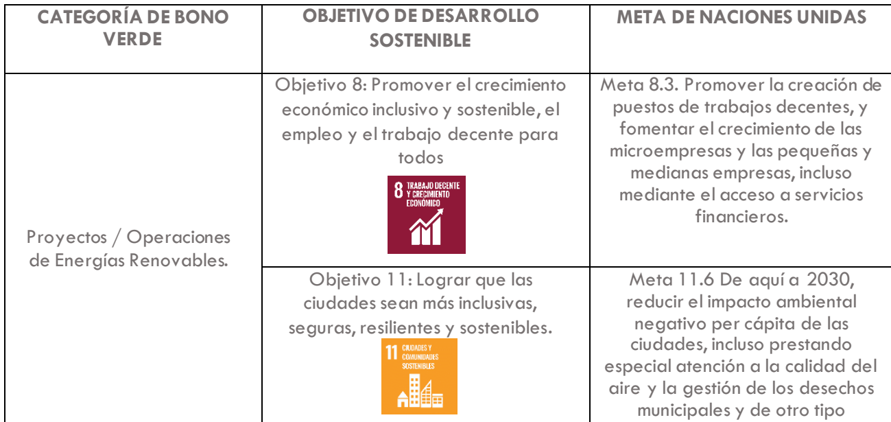
Tabla 2: Análisis del impacto – ODS colaterales

Por otro lado, se ha reconocido una contribución colateral al ODS 8. Trabajo Decente y Crecimiento Económico y al ODS 11. Ciudades y Comunidades Sostenibles. También se han precisado las metas específicas de Naciones Unidas 8.3. Promover la creación de puestos de trabajos decentes; y 11.6. Reducir el impacto ambiental negativo per cápita de las ciudades, incluso prestando especial atención a la calidad del aire; las cuales, si bien no están en el core de la operación de la PHR, se considera que existirá una contribución positiva y favorable para los grupos de interés.: